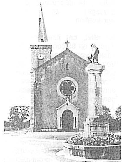
La colonne et l'église

La carrière de grès ou de molasse dure de Verrières alimentait au siècle dernier les chantiers de construction de Genève, elle a aussi fourni les matériaux de l'église de Saint-Julien.