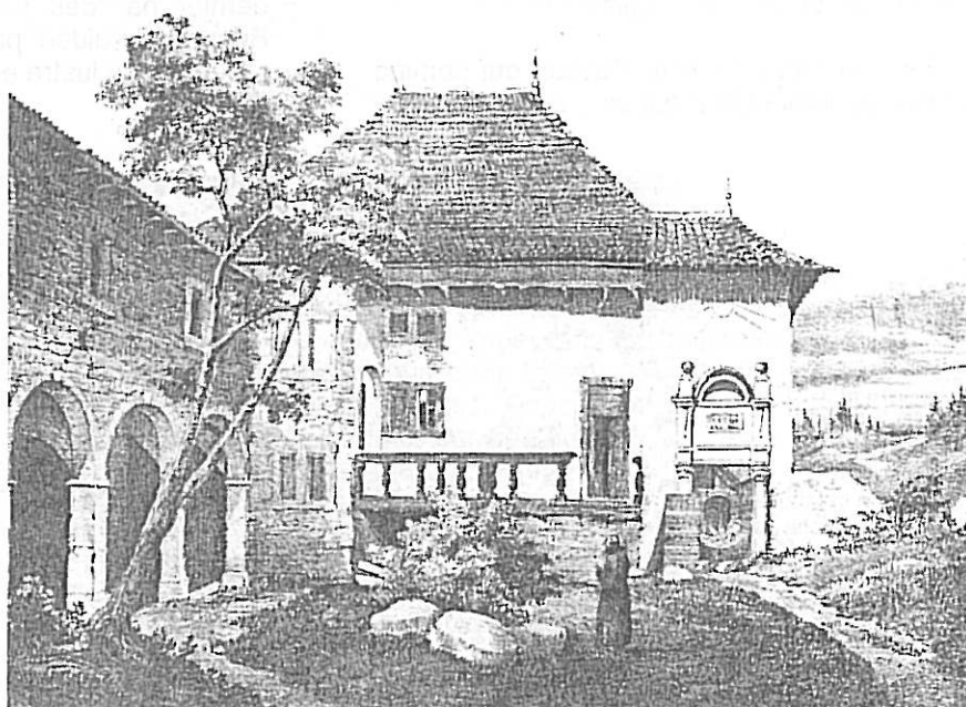
La chartreuse de Pomier (gravure extraite de l'Album de la Suisse romane)